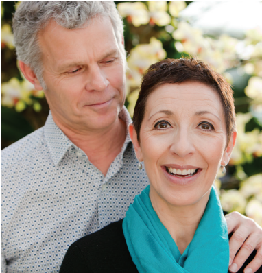
بہن سے نرم کریں

ذاتی بیان: اگر آپ نے ہماری میلنگ فہرست میں شمولیت کے لیے نہیں کہا تو آپ کی معلومات ہں آپ کو معلومات بھیجنے کے مقصد کے لیے استعمال ہونگی، جن کے لیے آپ نے گزارش کی ہے اور ہمارے پاس محفوظ نہیں ہونگی؛ ایک دفعہ جب معلومات کے لیے درخواست پر عمل ہو جائے تو آپ کی معلومات بحفاظت طریقے سے ضائع کر دی جائیں گی۔ اگر آپ نے ہماری میلنگ فہرست میں شمولیت کے لیے کہا ہے تو آپ کی معلومات ہمارے محفوظ ڈیٹا بیس میں ۱۹۹۸ کے ڈیٹا کے حفاظتی قانون کی شرائط کے تحت برقرار رکھی جائیں گی۔